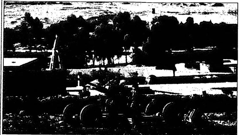
جنود اريتريون في مزرع حديدي (مخبر)

ولدت منظمة الوحدة الإفريقية في 25 مايو 1963م، وكان عدد أعضائها حينئذٍ 52 دولة، وفي عام 2002م بلغ عددها 53 دولة، وهي منظمة إقليمية تضم دولتين من إفريقيا الشمالية وهما ليبيا وجزيرة القمر، وبقية الدول الأعضاء هي من إفريقيا جنوب الصحراء. وتعد منظمة الوحدة الإفريقية منظمات إقليمية ذات طابع سياسي، وتعمل على تعزيز التعاون بين أعضائها في مختلف المجالات، مثل الاقتصاد، والثقافة، والتعليم، والصحة، والبيئة، وغيرها. وتعد منظمة الوحدة الإفريقية من المنظمات التي تسعى لتحقيق العدالة الاجتماعية والتنمية الاقتصادية في قارتها.